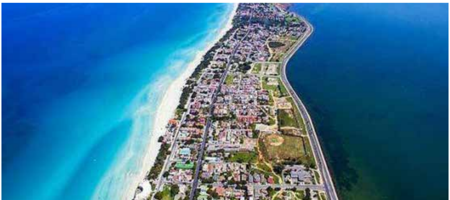
Las playas de Varadero en pleno esplendor

perfecta para fotografiar: Arena dorada, agua azul turquesa e impresionantes atardeceres. Las suaves olas son perfectas para nadar, hacer esnórquel o kayak. Súbete a un catamarán, sal a pescar, juega una ronda de voleibol playa, camina por la costa: hay mucho para hacer. O simplemente relájate y disfruta del hermoso paisaje natural (realmente no puedes equivocarte)».