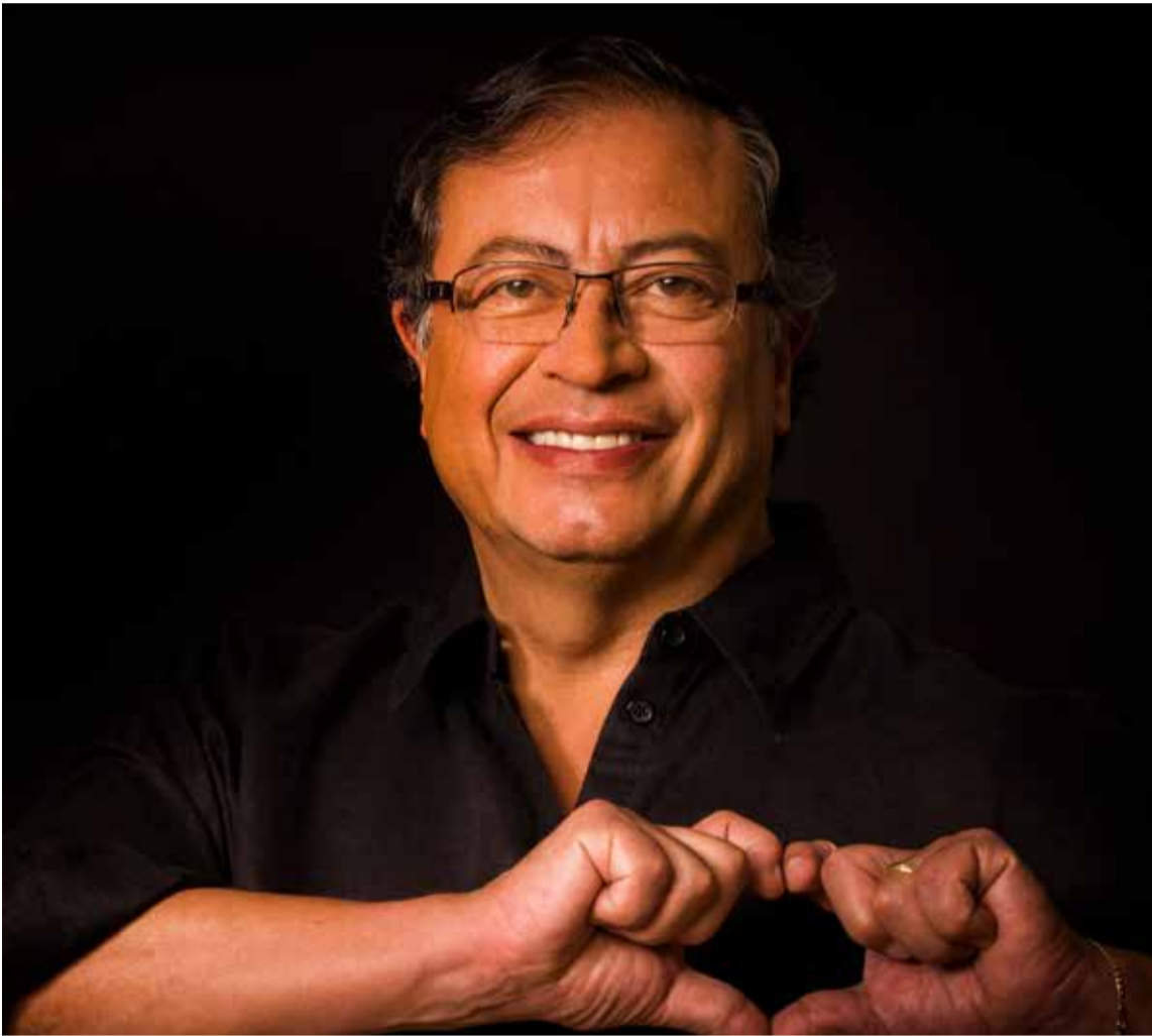
Gustavo Petro Urrego, presidente de Colombia.

El presidente Gustavo Petro planteó abrir un diálogo con el poder judicial para avanzar en los cambios que necesita Colombia, de manera urgente e imprescindible.