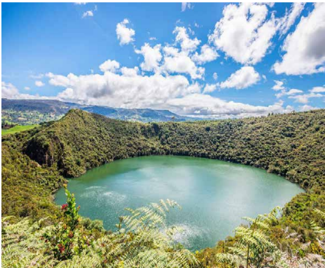
Laguna de Guatavita

El Embalse de Tominé, abarca 18 kilómetros y queda en predios de los municipios de Guasca y Sesquilé, el objetivo de su construcción fue «regular