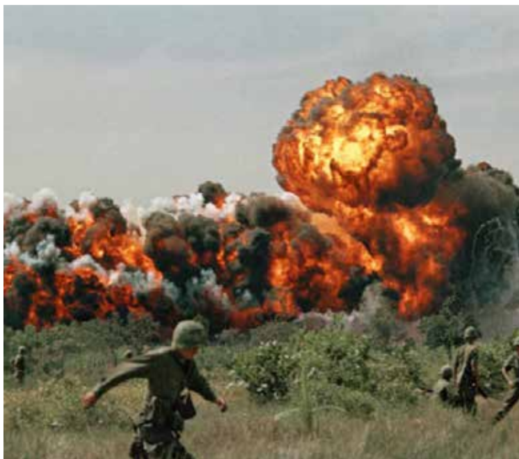
La guerra afectará a toda la humanidad.

Es bien sabido, que la guerra de hacerse efectiva, solo traería consigo un hálito de pena, dolor y muerte, que