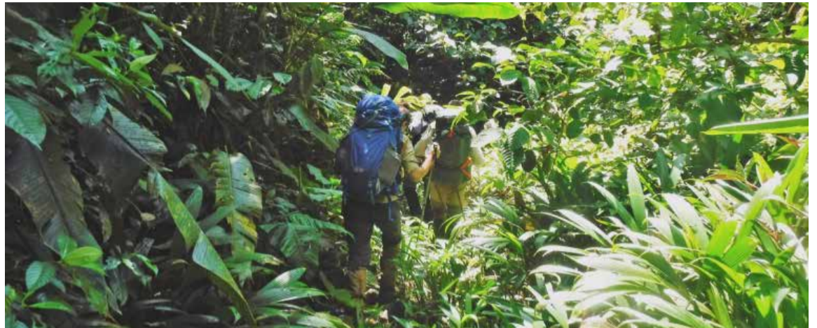
Atravesar el Tapón del Darién, una espesa y peligrosa zona selvática, ruta de migrantes irregulares en la región que comparten Colombia y Panamá a los largo de 266 kilómetros, desde el Golfo de Urabá hasta el océano Pacífico.

Un caso de estos fue detectado en septiembre en Turbo. En las calles del centro de esta ciudad de 165.000 habitantes, cinco niños ecuatorianos vagaban solos. Sus rasgos indígenas, entre una población mayoritariamente negra; su ropa inapropiada para el clima caluroso y sus pequeñas mochilas a la espalda, llamaron la atención de la Policía, que los recogió y los llevó a la Comisaría de