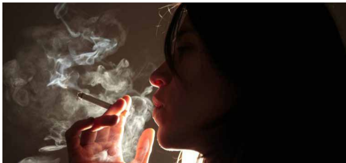
Fumadores, cada día menos.

«Todavía nos queda un largo camino por recorrer, y las empresas tabaqueras seguirán utilizando todos los trucos de manual para