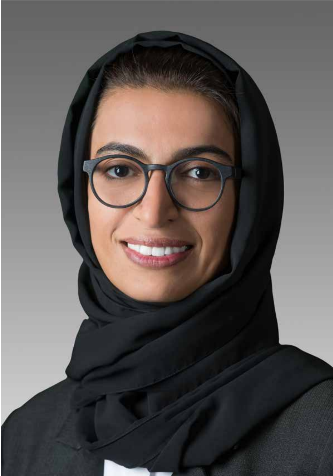
Noura bint Mohammed Al Kaabi es Ministra de Estado en el Ministerio de Asuntos Exteriores y es un ejemplo del papel que juega la mujer en Emiratos Árabes Unidos.

Las mujeres emiratíes han logrado impulsar el desarrollo nacional, subrayando también la visión futura del papel de la mujer en la sociedad del Emirato.