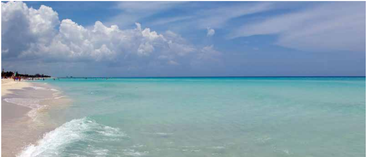
La playa de Varadero

Sobresale por su belleza natural y diversidad de actividades turísticas y culturales en un clima cálido durante todo el año, resultado de positivo de un promedio de opinio-