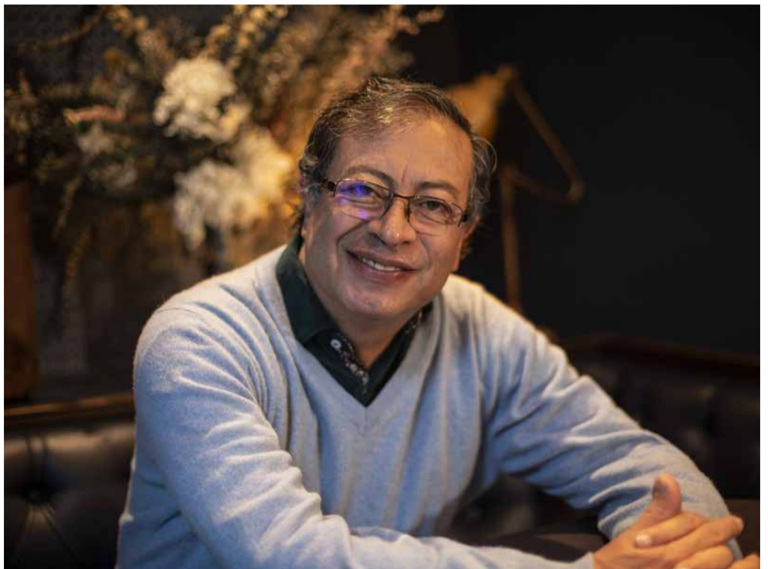
«Cinco politiqueros pagos no van a hundir la democracia en Colombia»: Petro sobre decisión del CNE

El Consejo Nacional Electoral (CNE) decidió formular pliego de cargos contra el presidente Petro en calidad de can-