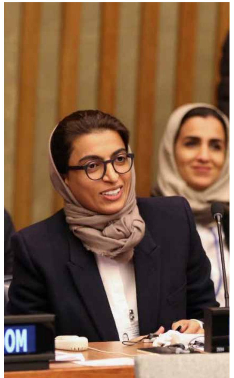
Mujeres representando a Emiratos Árabes Unidos, en las más altas cumbres mundiales.