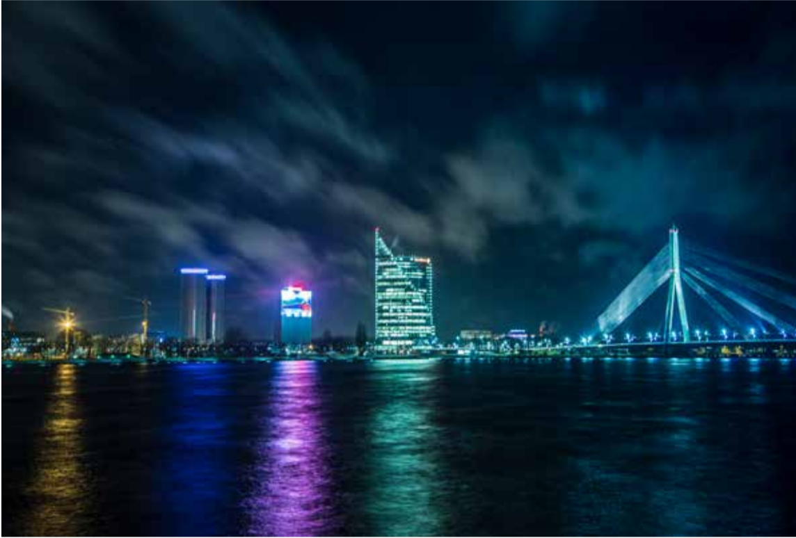
Vista nocturna de Riga, la capital de Letonia.

Letonia recuperó su independencia de la Unión Soviética en 1991. Situada en la costa del Báltico, es un país de llanuras bajas pobladas de extensos bosques que proporcionan madera para la construcción y la industria papelera. Su territorio abunda en fauna y flora. Letonia también produce bienes de consumo, productos textiles y herramientas mecánicas. El país atrae a turistas de toda Europa.