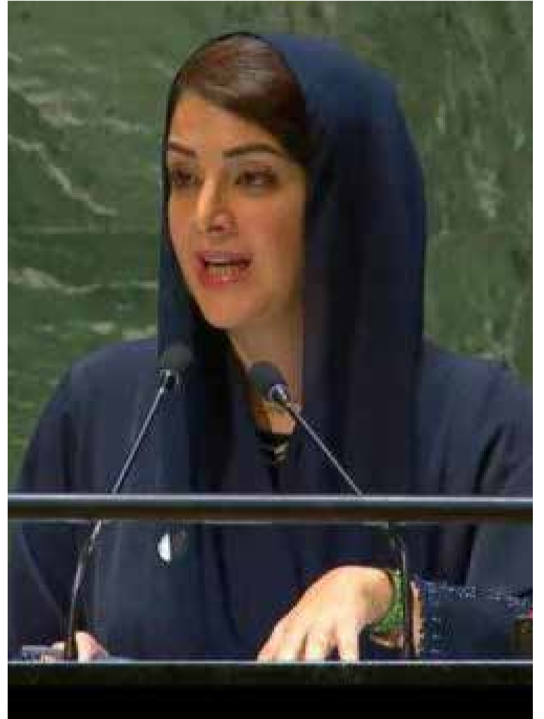
Noura bint Mohammed Al Kaabi es Ministra de Estado en el Ministerio de Asuntos Exteriores e interviene en la Asamblea de las Naciones Unidas.

Estas discusiones resultaron en un mayor entendimiento mutuo y en un reconocimiento internacional de las destacadas políticas emiratíes en este ámbito. El evento concluyó reafirmando el compromiso de los Emiratos Árabes Unidos de seguir apoyando y empoderando a las mujeres, considerándolas como una socia fundamental en la realización de la visión nacional y en alcanzar las aspiraciones futuras.