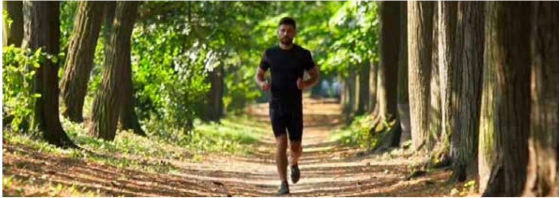
La naturaleza y el ejercicio contribuyen a la felicidad.

La alegría es una emoción placentera, a veces propiciada por la risa. La felicidad es un disfrute de lo que tenemos aquí, allá y ahora, concatenada con el sentido que le damos a nuestra vida desde las relaciones con los entornos vivos. La alegría nos puede provocar una sensación positiva relativa, la felicidad tiene un efecto permanente en nuestro bienestar, benéfico para la salud que debe ser oxigenado con buenas