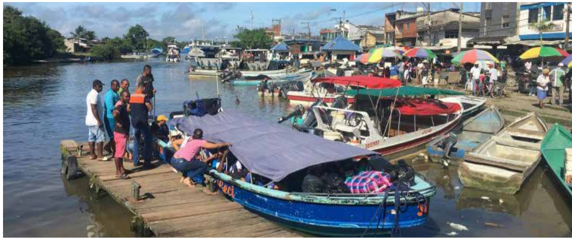
Desde el muelle de Turbo y playas cercanas a esa población del Urabá antioqueño salen cada año migrantes de varias partes del mundo que buscan atravesar el peligroso Tapón del Darién, rumbo a Estados Unidos.

En casos como estos, los migrantes entran a Colombia y permanecen en el país de manera irregular, no cuentan con sellos en el pasaporte y algunos ni siquiera tienen documentos, cuenta el oficial de policía. «Los nombres que uno plasma en los oficios son porque ellos mismos los es-