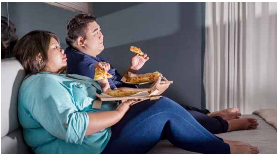
Obesidad la enfermedad del mundo.

La obesidad infantil se asocia con una mayor probabilidad de muerte prematura y discapacidad en la edad adulta. Sin embargo, además de estos riesgos futuros, los niños obesos sufren dificultades respiratorias, mayor riesgo de fracturas e hipertensión y presentan