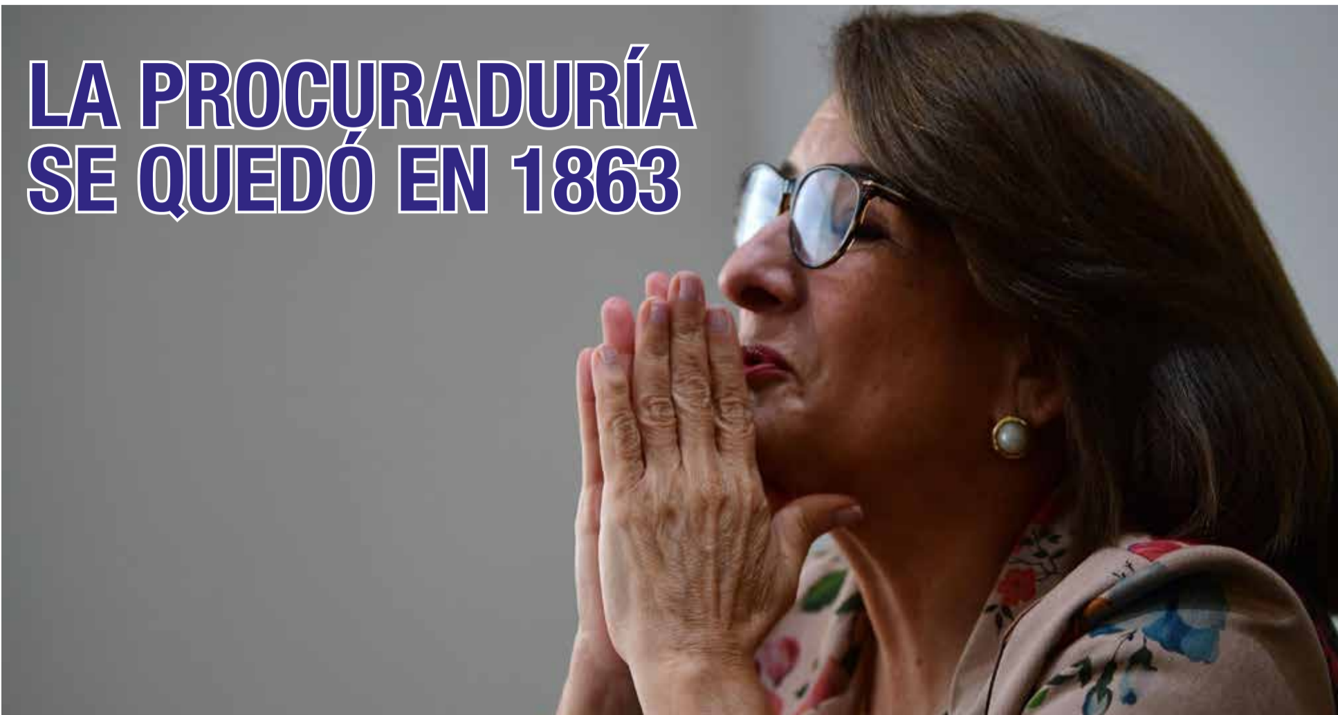
Margarita Cabello, procuradora saliente.